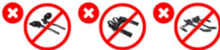
Obr. 5.2.2 - k bodu 5.2.3 d)

5.2.9f při povolené jízdě v háku je zakázané mít držák na lahev za sedlem.